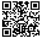
レンタルバイク 申込フォーム

当日はマウンテンバイクコースを無料開放いたします。自転車を持ち込まれるお客様は、ご自由にお使い下さい。レンタルバイクご希望の方は、8台しかございませんので申込順とさせていただきます。 ※コース利用の皆様は別途保険料を頂戴いたします。