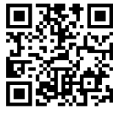
レンタルバイク 申込フォーム

当日はマウンテンバイクコースを無料開放いたします。自転車を持ち込まれるお客様は、ご自由にお使い下さい。レンタルバイクご希望の方は、8台しかございませんので申込順とさせていただきます。 ※コース利用の皆様は別途保険料を頂戴いたします。