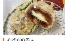
そば 630円 + 祇園坊柿の天ぷら 350円 祇園坊柿の天ぷら(チーズ入り) 400円