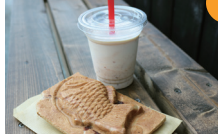
祇園坊柿シェイク + 鯛焼き 560円