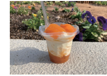
祇園坊ソフトクリーム 400円