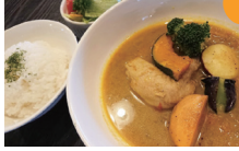
祇園坊柿のスूपカレー 1,100円

休 月曜日・火曜日 営 【水・木・金】 11時～15時 【土日祝】 11時～16時