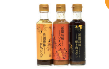
祇園坊柿ソース・ドレ・焼肉のたれ*

休 水曜日 営 【平日】 10時～17時 【土日祝】 10時～15時 ※ 飲食のメニューは準備できしだい開始