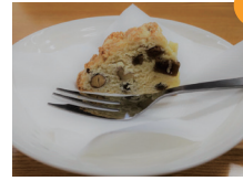
祇園坊柿のソーダブレッド

休 当面は休まず営業 営 10時～21時 ※利用者がいない場合は19:00を目途に営業を終了