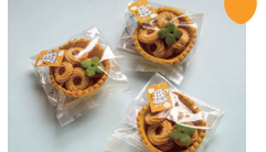
祇園坊柿ジャムのクッキー

休 月曜日・火曜日 営 11時半～17時半 ※12月は土日のみ営業 ※ 昨年のメニュー、準備できしだい開始