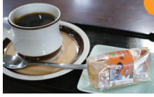
祇園坊ワッフルコーヒーセット 700円