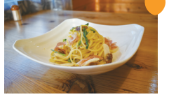
祇園坊柿と生ハムのスパゲティ 1,200円