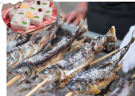
太田川源流域の清流の恵みを受けて育った川魚をご賞味あれ♪