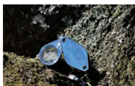
詳細・レンタル予約